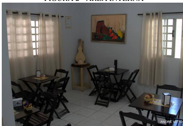
FIGURA 2 - ÁREA INTERNA

apresentado na Figura 2. Outro externo em que as mesas e cadeiras ficavam dispersas na varanda em um espaço lateral à residência, no qual as mesas encontravam-se à sombra de um pé de manga, exposto na Figura 3. Todos esses ambientes estavam carregados de uma atmosfera planejada de acordo com Mowen e Minor (1998) 8 citados por Rego e Silva (2003), em que as seções foram projetadas e decoradas com objetos, cores e sons que lembravam os hábitos cuiabanos, sendo importante destacar que a música ambiente era uma seleção das composições do Rasqueado cuiabano 9 .