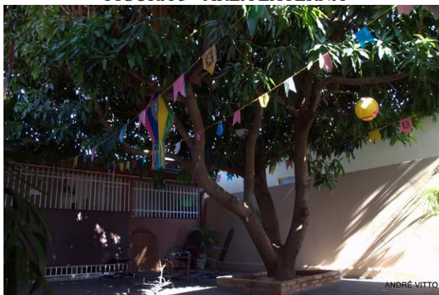
FIGURA 3 - ÁREA EXTERNA