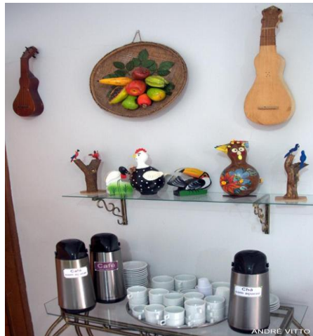
FIGURA 1 - MESA DO CHÁ E CAFÉ.

Verificou-se que a decoração exposta no “Chá com Bolo da Tia Fran” estava assinalada por diversos elementos que expressavam a cultura cuiabana, como, por exemplo, o uso dos tecidos de chita com amarrações e fixados na parede; a viola de cocho e o ganzá, que são instrumentos musicais de Cuiabá, estando dispostos para apreciação e possíveis registros fotográficos dos clientes. O ambiente também estava tomado por muitos quadros com pinturas que lembravam o Pantanal, bem como a sua fauna e flora; a mesa onde estavam dispostos o chá e o café estava decorada por objetos do artesanato cuiabano cuja matéria prima é a argila, em que são esculpidos os animais que compõem o bioma da baixada cuiabana, como também a moringa cuiabana, conforme a imagem abaixo: