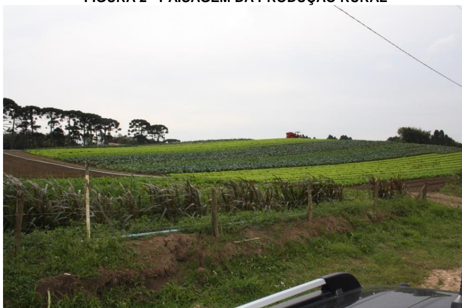
FIGURA 2 - PAISAGEM DA PRODUÇÃO RURAL