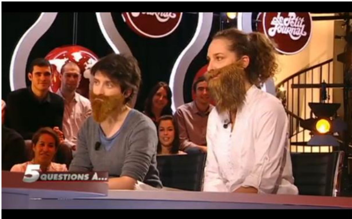
FIGURE 1 – Screenshot of La Barbe’s appearance on Le Petit Journal in their segment ‘5 questions à...’ on 9 December 2011.