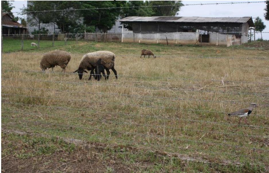
FIGURA 3 - CRIAÇÃO DE PEQUENOS ANIMAIS