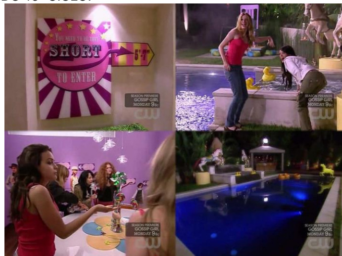
FIGURA 3 - IMAGENS DE ALGUNS CÔMODOS DA CASA ONDE FICARAM CONFINADAS AS CONCORRENTES DO 13º CICLO.

Às vezes, porém, as casas não sugerem, mas ditam arbitrariedades. Exemplo disso aconteceu no 13º Ciclo, em que, pela primeira e única vez, a participação no programa foi limitada a candidatas com menos de 1,70 cm. Nesse Ciclo, as modelos eram sempre colocadas em ambientes, nos quais eram “advertidas” a assumir um comportamento infantilizado, reproduzindo nos ensaios fotográficos um “lolitismo” trabalhado em detalhes por todos os elementos que compunham a arquitetura da casa na qual estavam instaladas (Figura 3). Com isso, substituiu-se a inadequação da altura (muito baixas para serem modelos) pelo erotismo eminente (baixas o suficiente para serem ninfetas). Com isso, a impossibilidade imagética de aceitar uma modelo baixa era compensada construindo, a todo tempo, o signo esbravejante do erótico. E a arquitetura estava lá, como cúmplice na formulação sígnica.