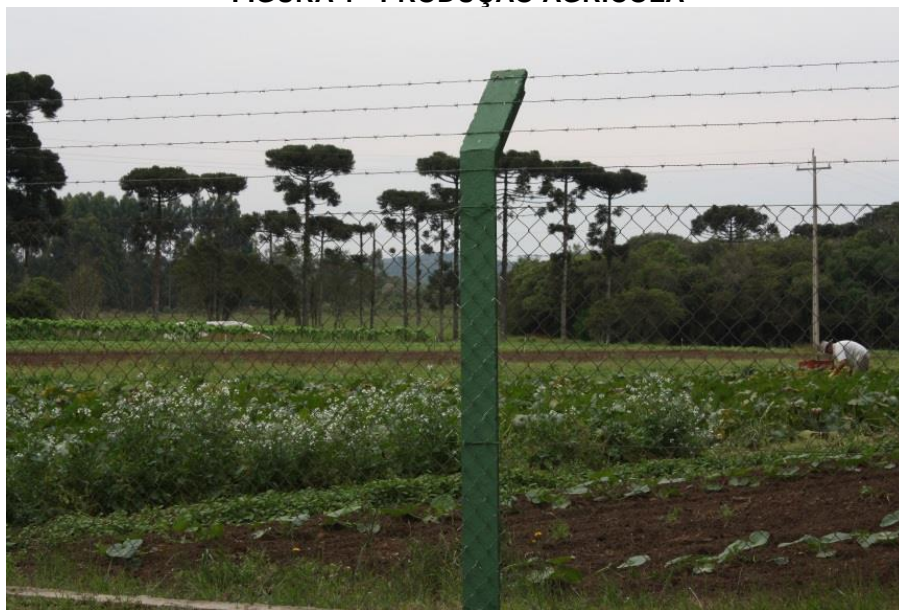
FIGURA 1 - PRODUÇÃO AGRÍCOLA

Nesse sentido é que permite pensarmos a existência de um turismo rural que oportuniza um contato com o cotidiano de vida dos atores locais, com ambiente e natureza local como esta demonstrada nas figuras (1 e 2) .