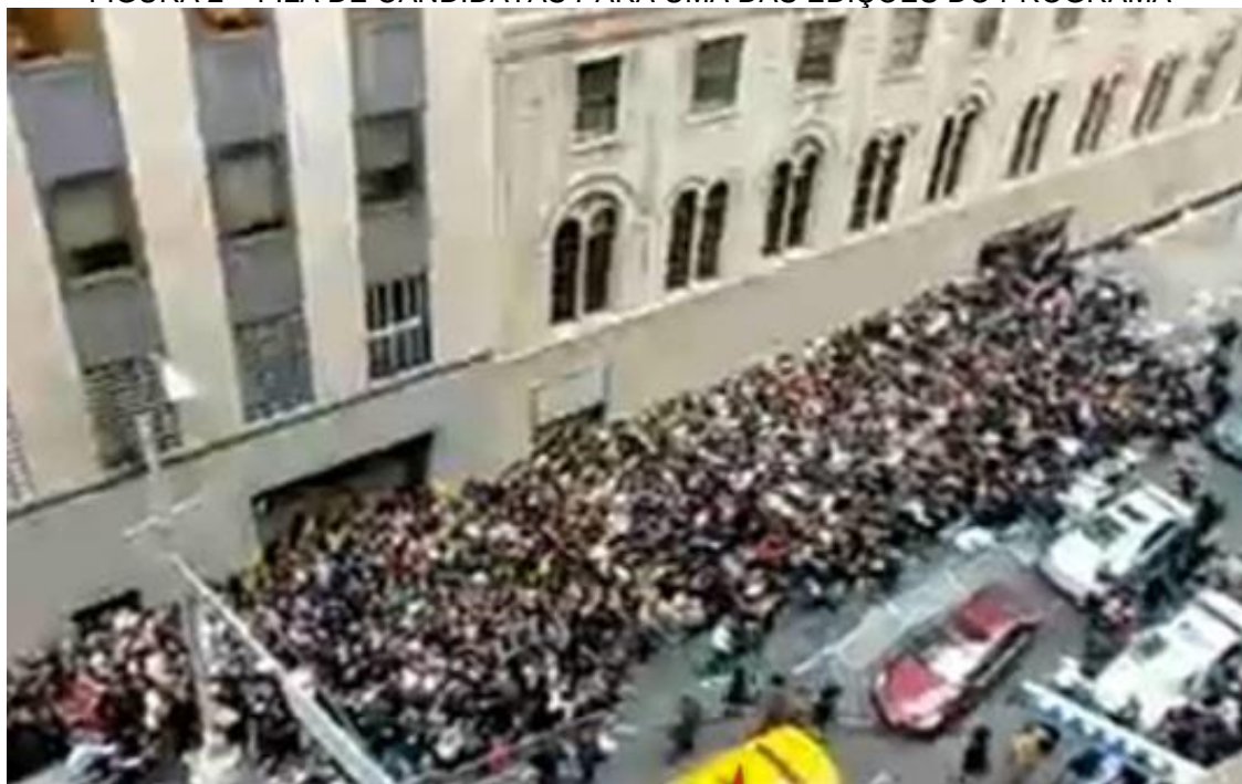
FIGURA 2 – FILA DE CANDIDATAS PARA UMA DAS EDIÇÕES DO PROGRAMA