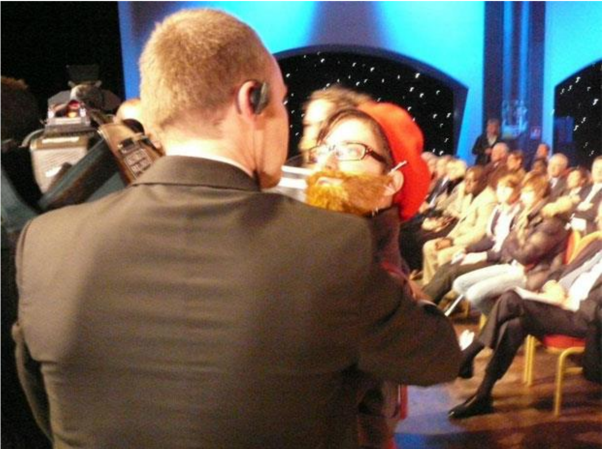
FIGURE 2 – Photo of La Barbe's intervention at the third UMP convention on 7 December 2011 in Paris.