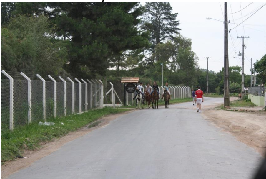
FIGURA 5 - ARTICULAÇÃO ENTRE O PASSADO E O MODERNO

atores locais (neste caso, normalmente, são os de filhos de produtores rurais que mantêm esse hábito) ainda é utilizado para locomoção de curtas distâncias. São tais situações que rebatem o olhar sobre o rural como algo “engessado” ou “imutável”, e que as consequentes ressignificações reafirmam o “rural” acima de tudo como categoria histórica e que se reinventa.