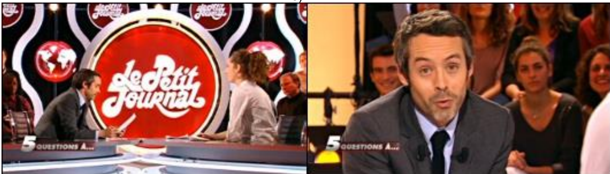
FIGURE 3 – Screenshot of La Barbe’s televised appearance, posted on Le Dernier des Blogs on 11 December 2011, with the caption: ‘In passing, it’s interesting to note that only the host has the right to seek the complicity of the viewer by looking straight at the camera...’ 59 (LAFARGUE, 2011, para. 5).

The most lucid analysis of the event and its aftermath in the media and on social media websites comes from media arts lecturer Jean-n el Lafargue, in a post on Le Dernier des blogs . Lafargue (2011, para. 5) briefly mentions the role played by the camera in creating complicity between the viewer and the host rather than between the viewer and the guests (see Figure 3).