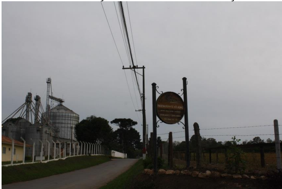
FIGURA 4 - COMPOSIÇÃO AGROINDÚSTRIA NO ESPAÇO RURAL