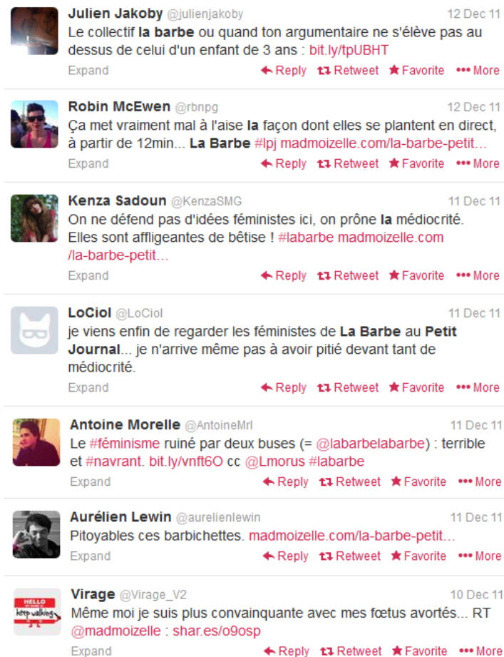
FIGURE 5 – Collection of examples of reactions on Twitter . 66