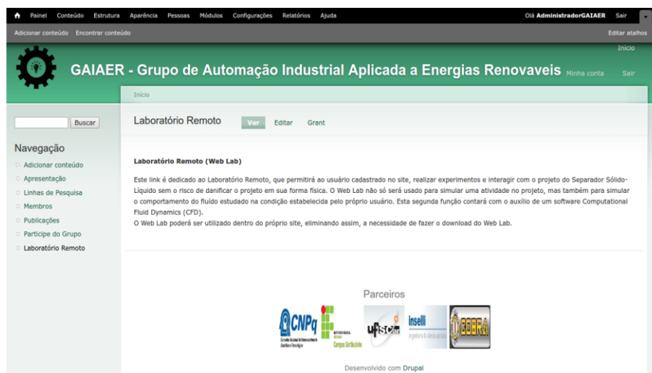
FIGURA 1. Website desenvolvido com o CMS Drupal.

A estrutura básica do website está completa, com todas as páginas com informações referentes ao projeto em questão, como mostrado na Figura 1.