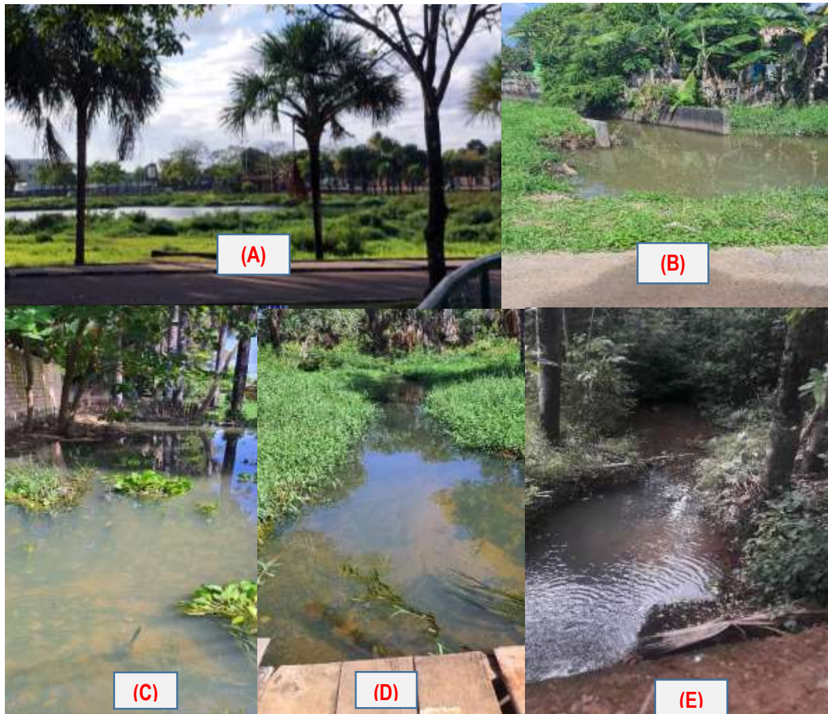
Figura 04: Fotos dos trechos avaliados do Igarapé Uai na zona oeste de Boa Vista-RR: (A) T1 - nascente; (B) T2 – Rua Jerusalém; (C) T3 – Rua Jt-10; (D) T4 – Rua Ônix; (E) T5 – Avenida Olímpica