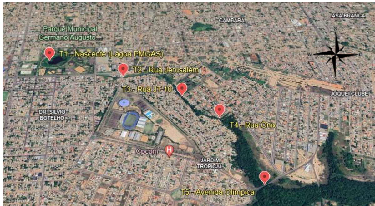
Figura 03: Trechos avaliados ao longo do curso fluvial do Igarapé Uai