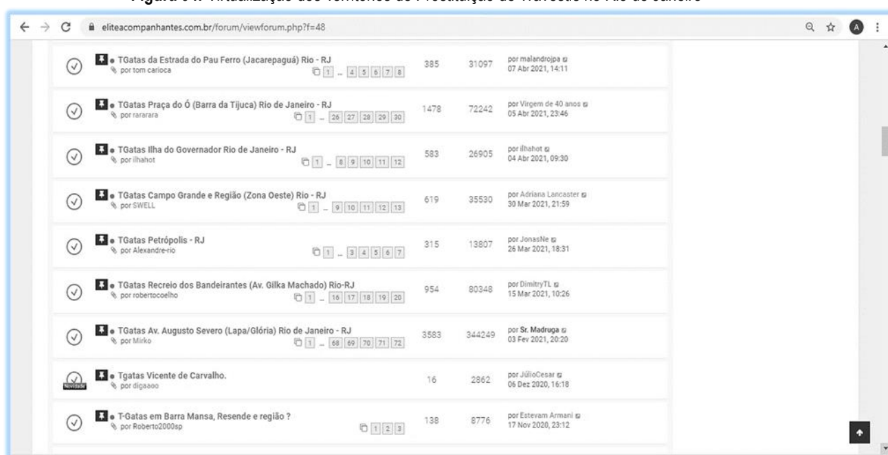
Figura 04: Virtualização dos Territórios de Prostituição de Travestis no Rio de Janeiro

Fonte: Fórum Elite Acompanhantes. Acesso em: 20 mai. 2021.