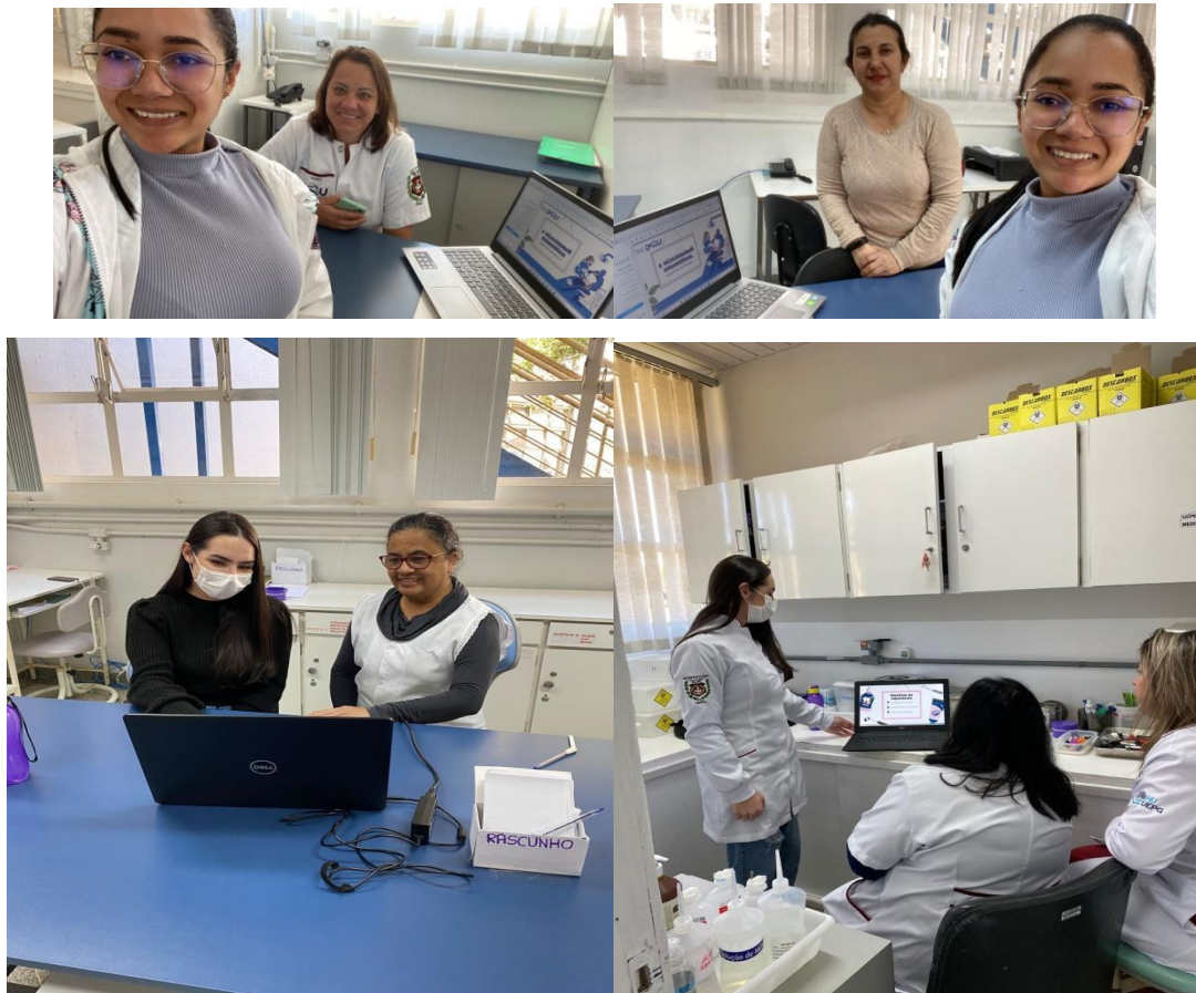
Figura 1 – Servidoras públicas do serviço odontológico durante a prática em saúde. UEPG, 2023.