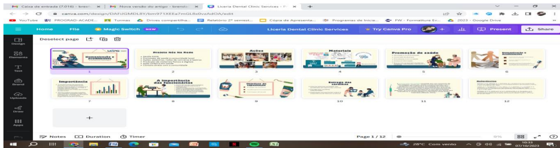
Figura 2 – Slides utilizados para a instrumentação das servidoras. UEPG, 2023.