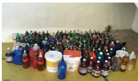
Figura 6 – Material recolhido na Gincana de Recolhimento de Óleo Usado.

A Gincana de Recolhimento de Óleo Usado superou muito as expectativas. Esperava-se que houvesse alguma participação, mas o volume surpreendeu até os responsáveis pelo projeto na SAMATUR. Até o final da Gincana, foram recolhidos 1032 litros de óleo usado. Muitos pais se empenharam e seguiram a recomendação de entrega nos dias de aula corretos. No turno da manhã, a turma do 4º ano (quarto ano) reuniu 85 litros, sendo a primeira colocada, enquanto o segundo maior volume coletado foi de 64 litros. No turno da tarde, a turma de 3º ano (terceiro ano) coletou 72 litros de óleo, enquanto a segunda posição foi ocupada com 56 litros, conforme ilustra a Figura 6.