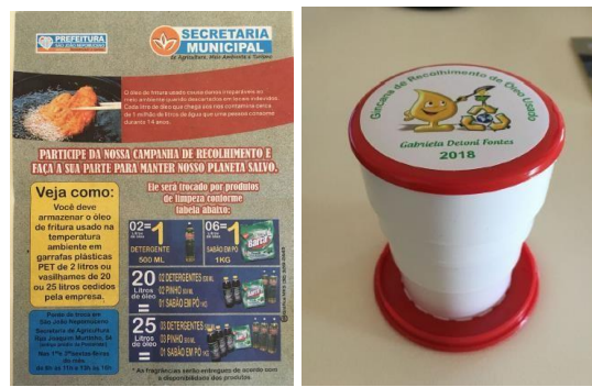
Figura 1 e 2 – Folder de divulgação da Campanha promovida pela SAMATUR e copo retrátil.