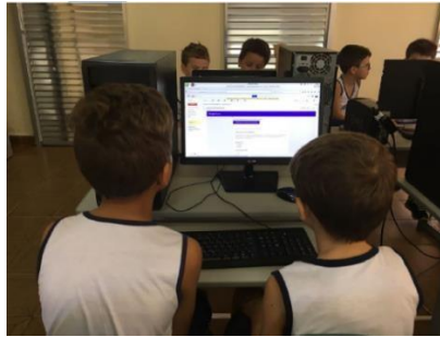
Figura 3 – Aplicação do formulário eletrônico às crianças anteriormente ao projeto.