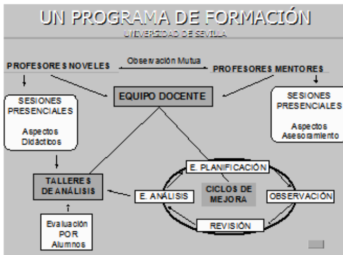
FIGURA 1 – PROGRAMA DE FORMACIÓN