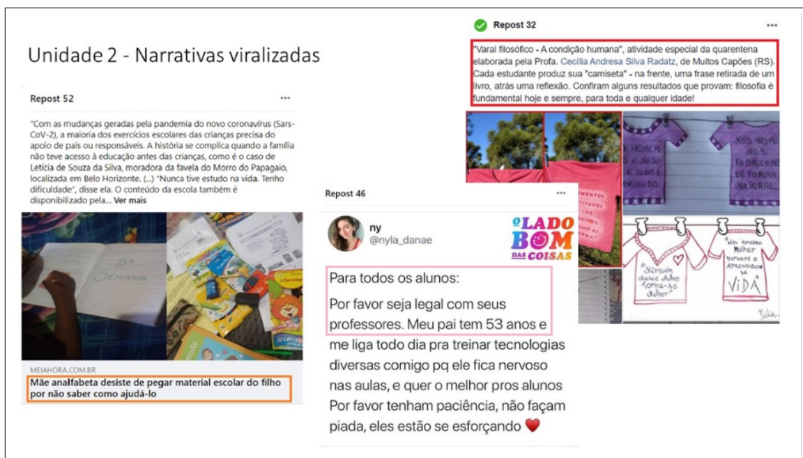
Figura 3. Exemplos de 'Narrativas viralizadas'.