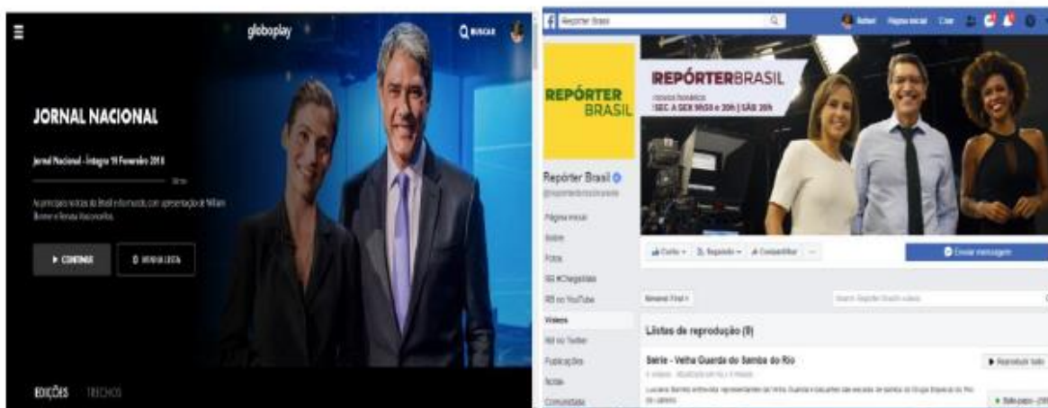
Figura 1: Globoplay e Facebook do Repórter Brasil

8