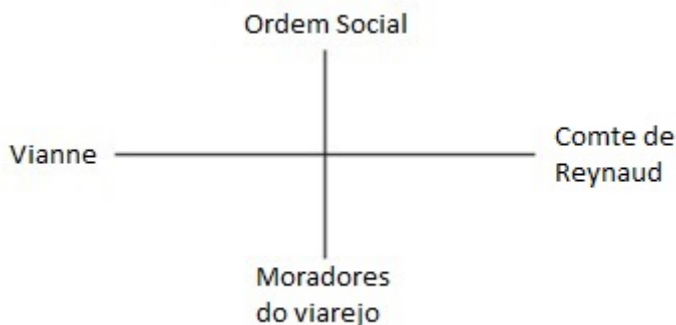
Figura 1 - A quaternidade mítica no filme Chocolate

As delimitações da quaternidade mítica consideradas por Canevacci (1990) encontram respectivas correspondências no filme Chocolate , resultando no seguinte esquema: